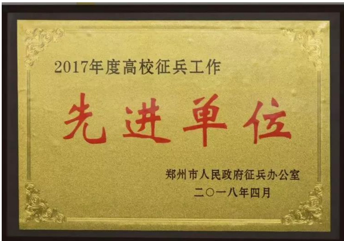
学院荣获 2017 年度郑州市高校征兵工作“先进单位”荣誉称号