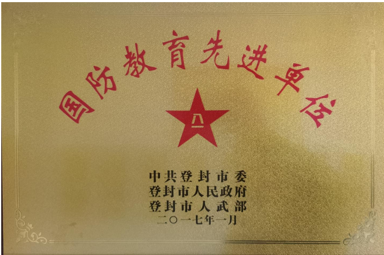
学院荣获 2018 年度郑州市高校征兵工作“先进单位”荣誉称号