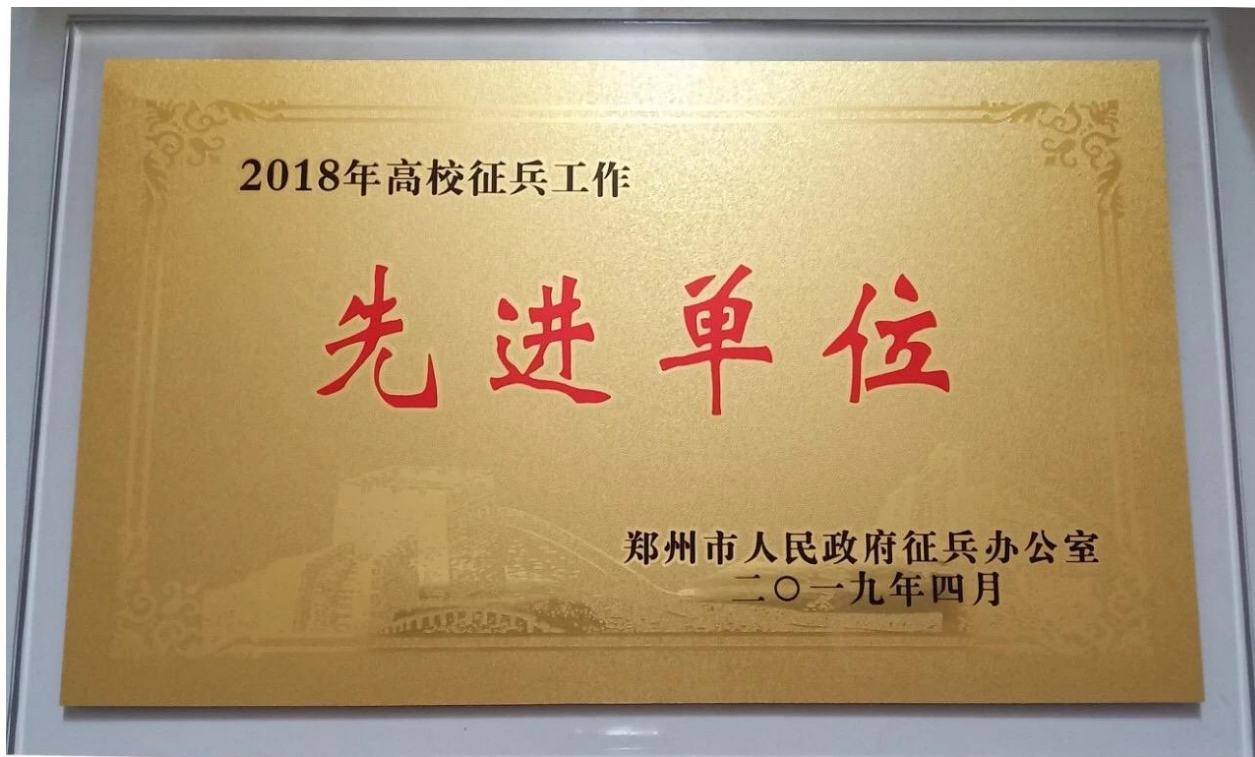
学院荣获 2018 年度郑州市高校征兵工作“先进单位”荣誉称号